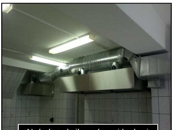
Vzduchotechnika v obecnej kuchyni