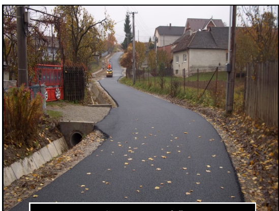
Smer na Tofeľ