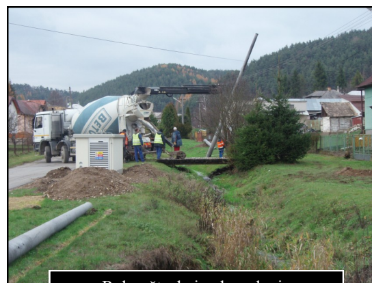
Rekonštrukcia el. vedenia