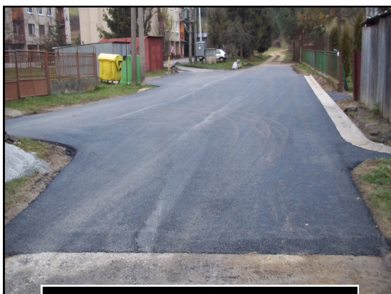
Smer k bytovým domom