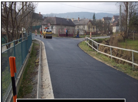
Miestna časť Huček